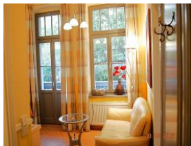
Blick in den Wohnraum.