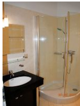
Blick in das Bad.