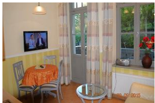
Blick in den Wohnraum und auf den Essplatz.