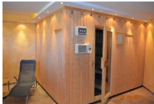
Blick in den Saunabereich im Hinterhaus.