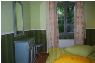
2. Blick in den Schlafraum.