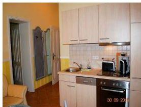
Blick auf die Küchenzeile.