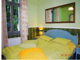
Blick in den Schlafraum.