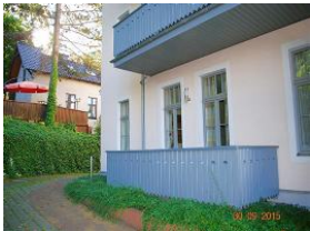
Blick auf den Balkon.