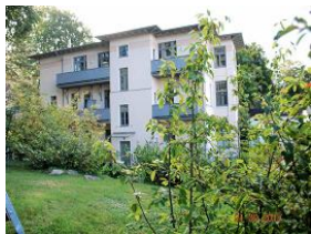
Blick vom Garten aus auf das Haus.

Das Haus San Marino ist in bester Lage, ruhig und strandnah im Seebad Heringsdorf gelegen. Das gemütliche und gut ausgestattete 31 m 2 große Erdgeschoss-Appartement 03 verfügt über einen Wohnraum mit komplett ausgestatteter Küchenzeile und Essplatz, kostenfreies WLAN, einen Balkon und ein Duschbad. Der Schlafraum ist mit einem Doppelbett und genügend Schrankraum eingerichtet. Haustiere sind auf Anfrage gestattet. Ein schöner Urlaubspatz für 2 Personen. Das Haus bietet einen Fahrradkeller, sowie Waschmaschine und Trockner zur gemeinschaftlichen Nutzung. Zu der Wohnung gehört ein PKW-Stellplatz auf dem Grundstück. Eine Sauna ist im Winterhalbjahr kostenfrei nutzbar. Wir sind Partner von UsedomRad. Leihen Sie sich bei uns im Büro ein Fahrrad aus und erkunden Sie die Sonnensinsel Usedom.