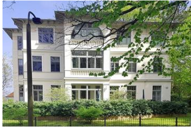
Frontansicht des Hauses.