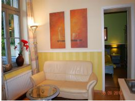
2. Blick in den Wohnraum und zum Schlafzimmer.