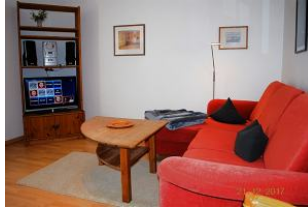
Blick auf das Entertainment.