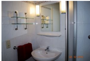
Blick in das Bad.