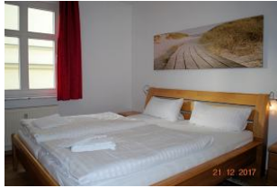
Blick in den Schlafraum.