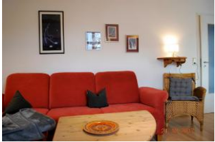
Blick auf die Sitzlandschaft.