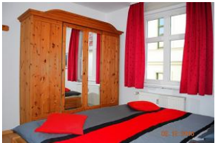
2. Blick in den Schlafraum.