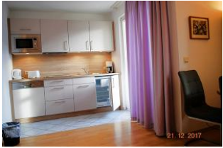
Blick von der Sitzlandschaft zur Küchenzeile und zum Essplatz.