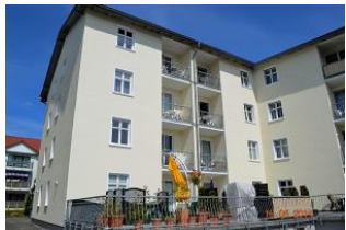
Der Balkon liegt im 1.OG links.

Vis a Vis zur Ahlbecker Seebrücke und unweit vom Ortszentrum entfernt, liegt das Haus Miramar. Das 40 m 2 große Appartement 15 hat Süd-/Westlage und liegt zum Innenhof des Hauses im 1. OG. Es ist gemütliche aber modern eingerichtet und verfügt über einen großzügigen Wohnraum mit Essplatz und Küchenzeile, einen Balkon, einen Schlafraum (Doppelbett) und ein Duschbad. Haustiere sind leider nicht gestattet. Ein Garagenstellplatz und kostenfreies Wlan stehen zur Verfügung. Umfangreiche Zusatzausstattungen (Sauna) im Haus. Wir sind Partner von UsedomRad. Leihen Sie sich bei uns im Büro ein Fahrrad aus und erkunden Sie unabhängig und flexibel die traumhafte und vielfältige Sonnensinsel Usedom. Als Kurkarteninhaber können Sie zudem die Busse der Usedomer Bäderbahn (UBB) kostenfrei nutzen.