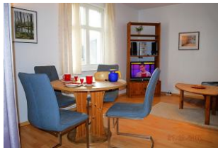
Blick in den Wohnraum und auf den Essplatz.