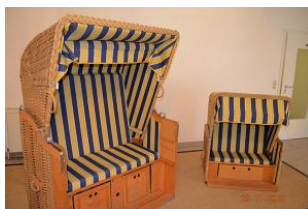
Strndkörbe begrüßen Sie im Hauseingang.